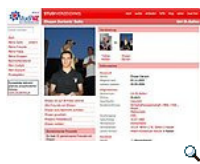
Dariani-Profil bei StudiVZ

Dariani: Bei uns kann jeder sofort Verantwortung übernehmen. Wir hatten einen neuen Praktikanten. An seinem zweiten Tag hat er die Bewerbungsgespräche für weitere Praktikanten übernommen. Manche Leute kriegen Angst, wenn Sie mit Leuten verhandeln, die 20 Jahre älter sind. Mir ist das egal. Die haben sich halt ein paar Mal öfter um die Sonne gedreht. In einem Startup gibt es viel mehr Aufgaben, als erledigt werden können. Da ist es wichtig, dass die Leute das Machtergreifen üben und das machen, was sie am besten können. Bei uns gibt es so gut wie keine Hierarchien. Die beste Idee setzt sich durch.