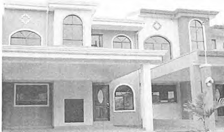
ARCHIVO EN PARA EF

El uso más común que le da el sistema financiero a la figura es el de garantizar créditos de vivien-