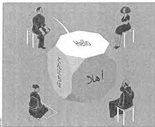
Illustration of a globe with people sitting around it, representing global communication and translation.

Las investigaciones y la comercialización de estos avances provienen de la intersección del sector privado y las comunidades de defensa e inteligencia. Siri tiene sus raíces en un proyecto de inteligencia artificial financiado por Agencia de Proyectos de Investigación Avanzados de Defensa de Estados Unidos (DARPA), por sus siglas en inglés. Su motor de reconocimiento de voz fue desa-