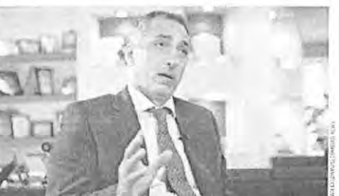
Egypt's central-bank governor, Tarek Amer, has relaxed some restrictions on Egyptian banks dealing with dollars as the government scrambles to get businesses the U.S. currency they need.

EGYPT section discussing the Egyptian government's efforts to address a dollar shortage, including relaxing restrictions on banks and the impact on the tourism industry.