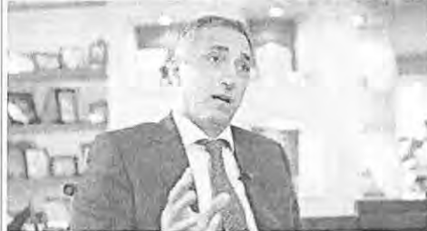
Central-bank Governor Tarik Amer reduced curbs on Egyptian banks that are dealing with dollars.

The bank said its adjusted return on tangible equity, a closely watched profit measure, stood at 11.4% in the quarter. UBS has been aiming for a figure of 15% and disappointed some analysts last year when it targeted its time frame for that target from 2016 to 2017.