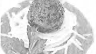
Alimentação feita de carne com células cultivadas para "steak-tops" Memphis Meats

neiro e professor de medicina na Universidade de Minnesota. "Nós acreditamos que, em 20 anos, a maioria da carne vendida em supermercados será cultivada em laboratório". Os benefícios potenciais podem ser enormes — são americanos, por exemplo, gastaram US$ 186 bilhões em carne de bovino, suínos e aves em 2014 e, neste ano, a Memphis Meats planeja anunciar sua estratégia e a criação de cerca de US$ 2 milhões em financiamento de firmas de capital de risco como a SOS LLC e a New Corp Capital. Alguns na indústria de carne dividem que os consumidores, muitos dos quais hoje exigem comida "natural" ou orgânica, não são adultos ou ingenuidade suficiente para acreditar no produto de uma carne desenvolvida a partir de células animais. Representantes de grandes fornecedores de carne dos Estados Unidos, como Tyson Foods Inc., Hormel Foods Corp. e Perdue Farms Inc., não comentaram oficialmente, mas a tecnologia ainda é muito nova. Mas os entusiastas com a maioria dos investidores forma de startups, como o cofundador do Twitter, Biz Stone e Evan Williams, inves-