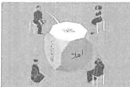
Un grupo de personas se reúne para discutir los avances en la tecnología de traducción automática. Los avances en la tecnología de traducción automática están acelerando este proceso. Esto significa que podremos comunicarnos con personas de otros idiomas sin necesidad de un intérprete humano. Esto es una gran noticia para el mundo globalizado que vivimos.

Los avances en la tecnología de traducción automática están acelerando este proceso. Esto significa que podremos comunicarnos con personas de otros idiomas sin necesidad de un intérprete humano. Esto es una gran noticia para el mundo globalizado que vivimos.