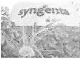
Gráfico da empresa