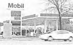
Exxon Mobil posted its lowest quarterly profit since 2002.