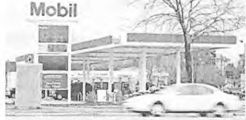
Exxon Mobil reported a 50% drop in fourth-quarter profit. The company's shares were down 3%.

The Dow Jones Industrial Average fell 260 points, or 1.6%, to 16,919 midmorning. The