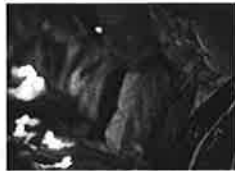
携手祈福 珍爱和平