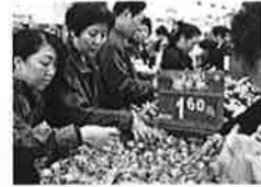
吉林秋菜陆续上市