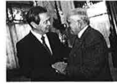
中国驻法使馆举行国庆62周年招待会