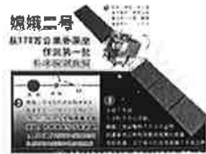
嫦娥二号从172万公里外深空传回第一批科学探测数据